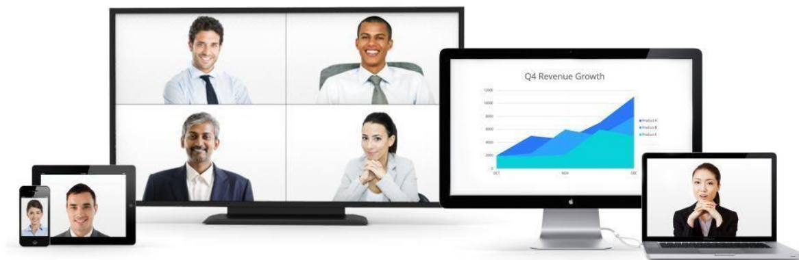
Fig1: Servicio Webinars & Streaming

Los principales usos empresariales del servicio de Webinar & Streaming son para la generación de leads, lanzamiento de productos, capacitaciones y eventos para empleados o socios de negocio.